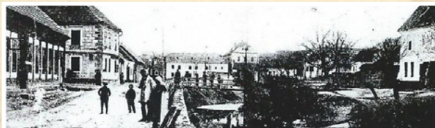
Pohľad na „Horný“ koniec Myjavy začiatok 20. storočia